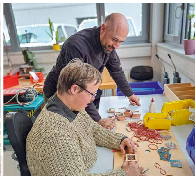
Gute Zusammenarbeit mit den Kollegen von Siemens Healthineers und ResMed beim Schichtwechsel