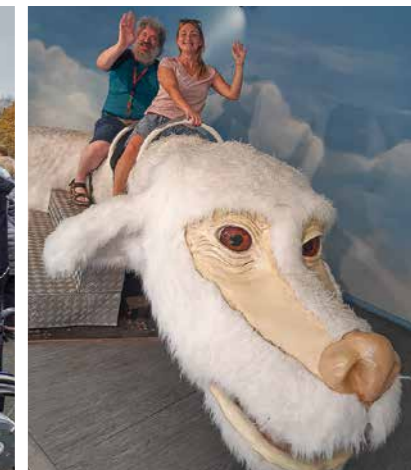
Ritt auf der berühmten Drachenfigur Fuchur