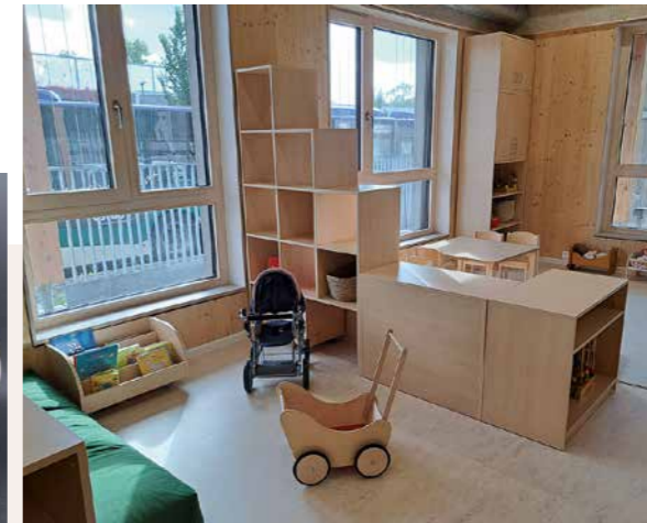
Innenräume im neuen Inklusiven Kinderhaus in Bruck