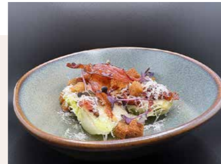
Leichte Küche mit Extranote im Patio