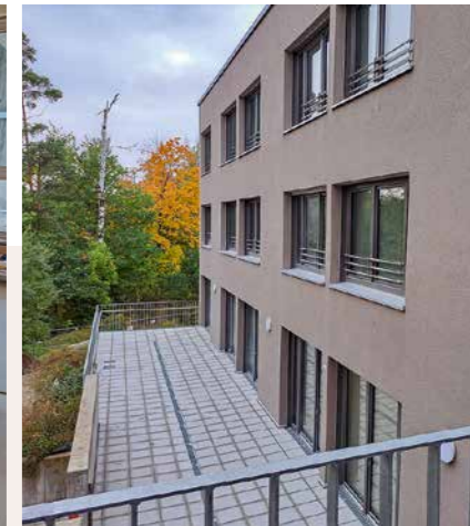
Bald können die Bewohnerinnen und Bewohner hier einziehen.