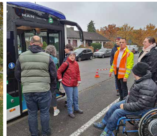
Ein gelungenes Treffen mit den Stadtwerken