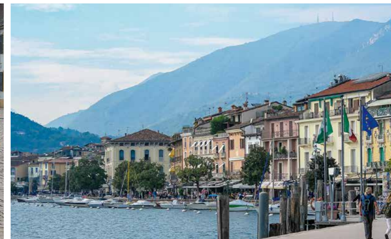
Lebenshilfe „Reise für Alle“ ging im Sommer nach Italien.