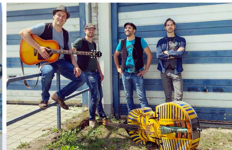
Die Band La Boum spielt bei Live & Lokal.