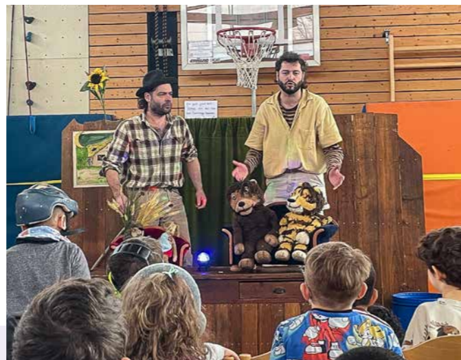
Großer Theaterspaß in der Schule