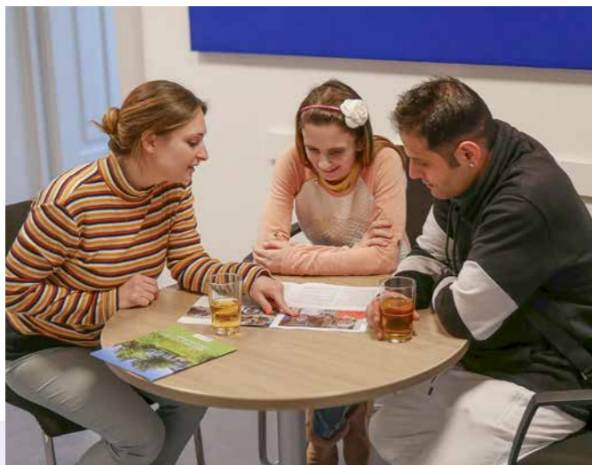
Assistenznehmer*innen im Gespräch mit Assistentin