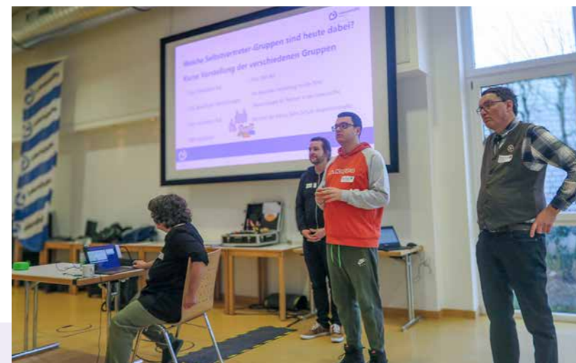
Auf dem Selbstvertreter-Kongress wurde konzentriert gearbeitet.

Lebenshilfe zu stärken. Wir wollen Sie zudem über die Gründung unserer Inklusionsgesellschaft informieren. Sie wird im KuBiC (ehemals Frankenhof) Hotel und Bistro betreiben. Wir hoffen, dass wir im Herbst starten können. Wir freuen uns auf Ihr Kommen.