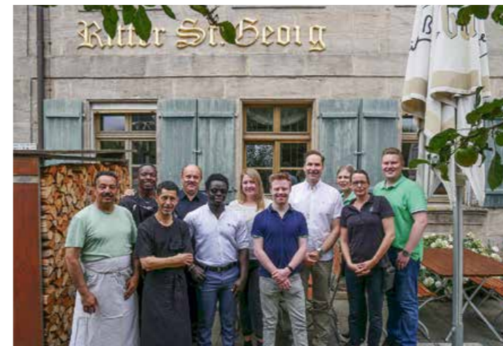
Ein buntes Team

Der Sammelband „Digitale Teilhabe und personenzentrierte Technologien im Kontext von Menschen mit Behinderungen“ (234 Seiten) ist auf www.lebenshilfe.de/shop/buecher.de für 27,50 Euro plus Versandkosten erhältlich. Oder im Buchhandel. ISBN: 978-3-88617-231-3