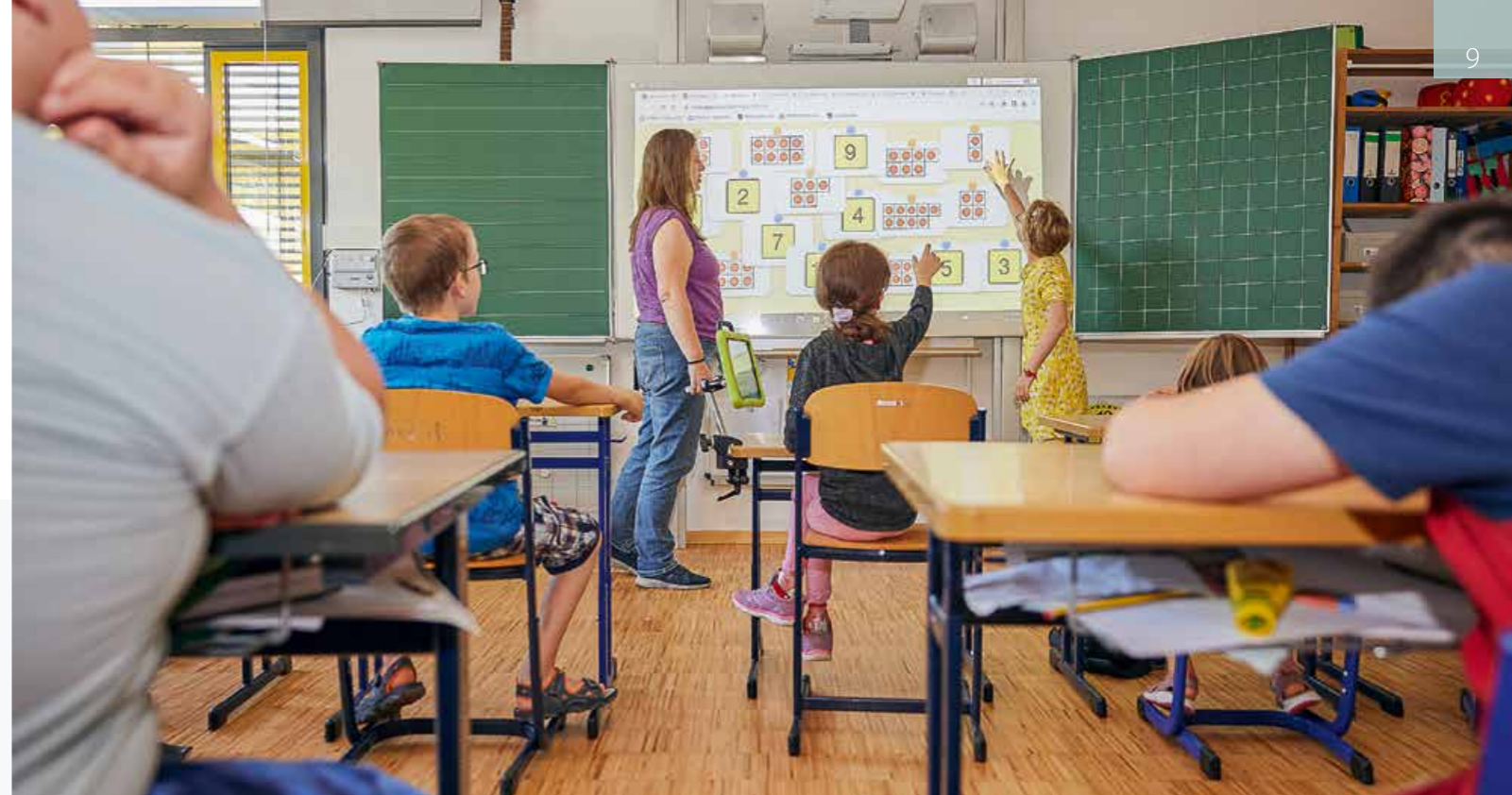
Gutes Miteinander in der Schulgemeinschaft und im Unterricht sind wichtig.

Ohne die Methoden der Unterstützten Kommunikation und dem WKS-Modell wäre es sicher nicht zu Helgas erstaunlicher Entwicklung gekommen. Hätten wir diese Reise des Ausprobierens nicht angetreten – alle Kolleginnen und Kollegen machen mit – wäre Helga (und auch unseren anderen Klientinnen und Klienten) nicht diese Aufmerksamkeit zuteilgeworden. Ich denke, die Initialzündung war, ihren starren Tagesplan aufzubrechen, ihr mehr Wahlmöglichkeiten anzubieten und dass wir mehr mit ihr reden. Schließlich kam der Moment: Helga setzte sich im Sofa auf und rief mehrmals laut: „Hilf mir mal!“