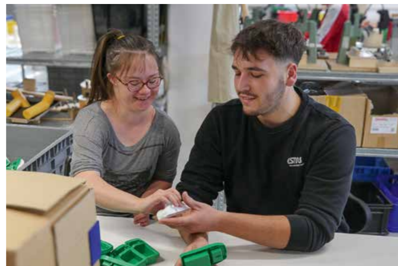
Selbstverständliche Zusammenarbeit beim Schichtwechsel