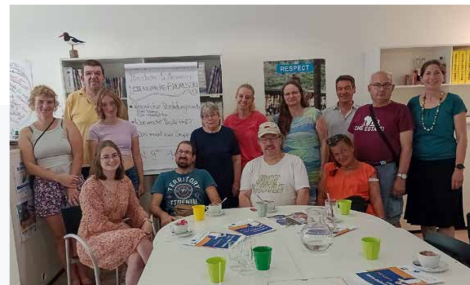
Treffen mit der Selbstvertretungsgruppe People First in Bozen