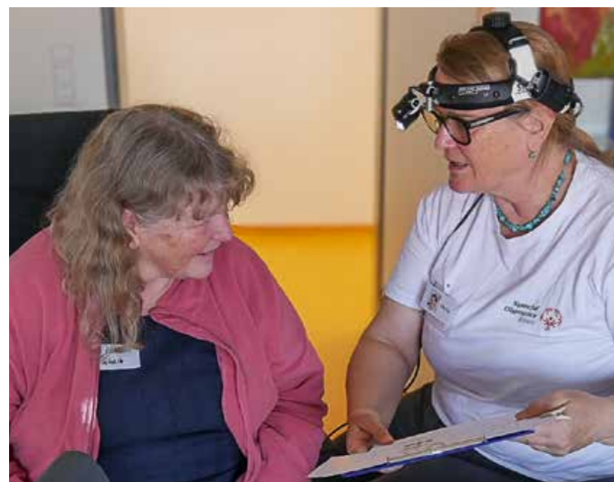
In der Werkstatt ging es zwei Tage lang ums Hören