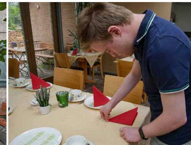
Das Falten Servietten klappt perfekt.